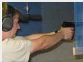
Pistole & Revolver