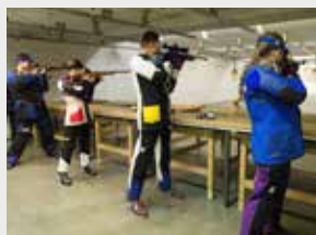
Klein- & Großkaliber